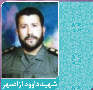
شهید داوود آزادمهر