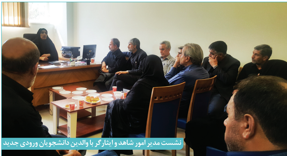
نشست مدیر امور شاهد و ایثارگر با والدین دانشجویان ورودی جدید

آمار دانشجویان شاهد و ایثارگر ورودی ۱۳۹۷ به تفکیک مقطع تحصیلی و محل تحصیل