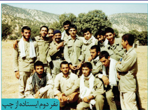
نفر دوم ایستاده از چپ