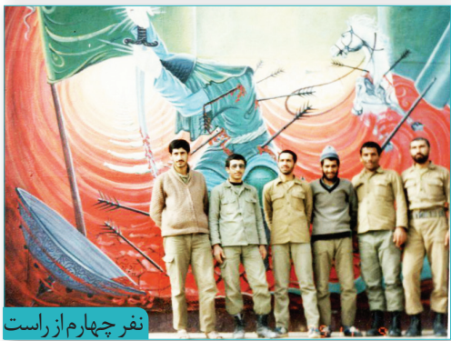
نفر چهارم از راست